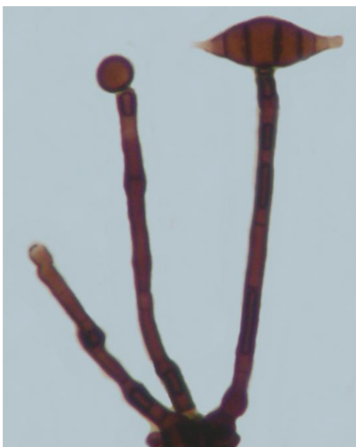
Conidióforos con conidio joven y maduro

Autor: Dra. Gabriela Heredia Abarca gabriela.heredia@inecol.edu.mx